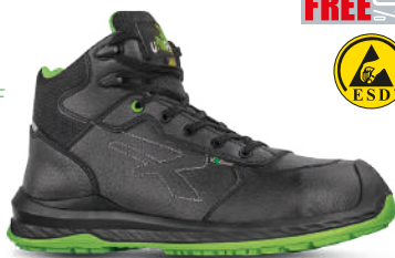
Puntalino di rinforzo in PU