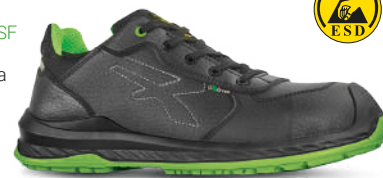
Puntalino di rinforzo in PU