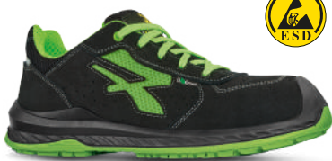
Puntalino di rinforzo in PU