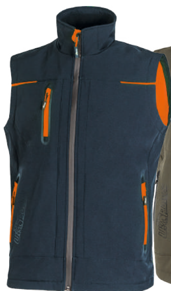
code FU188DB col. DEEP BLUE