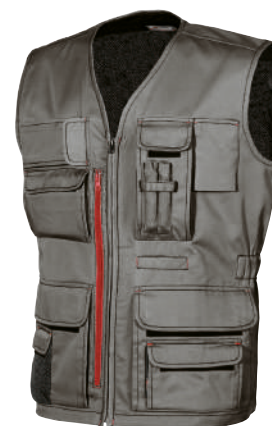
code HY018SG col. STONE GREY