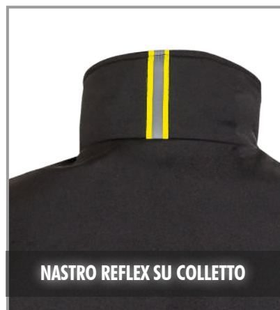
NASTRO REFLEX SU COLLETO