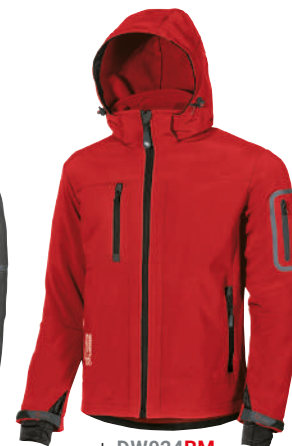
code DW024RM col. RED MAGMA