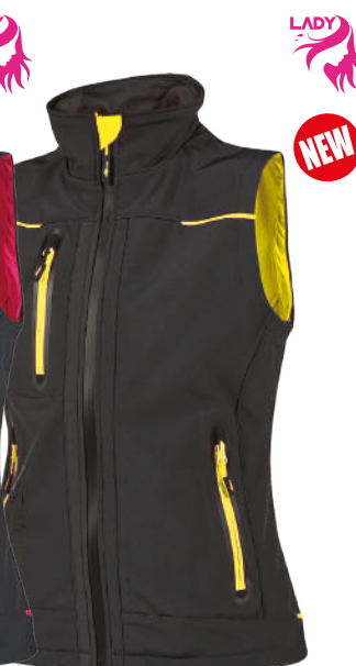
code FU260BC col. BLACK CARBON sizes XS-3XL