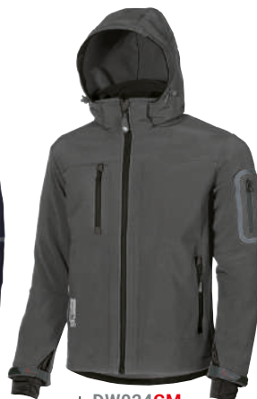
code DW024GM col. GREY METEORITE