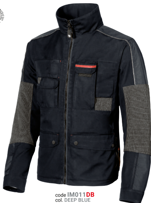
code IM011DB col. DEEP BLUE