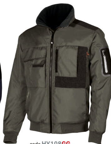
code HY108GG col. GREY GRAPHITE