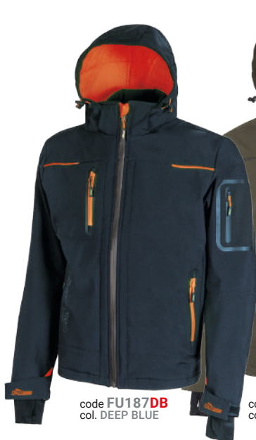
code FU187DB col. DEEP BLUE