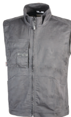
code EY148GI col. GREY IRON