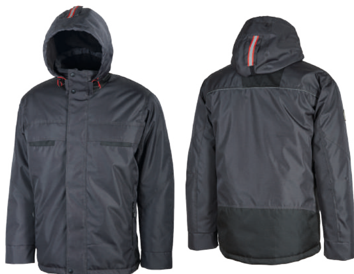
code DW026GM col. GREY METEORITE