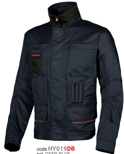
code HY019DB col. DEEP BLUE