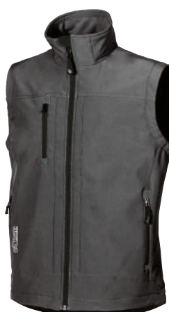
code DW025GM col. GREY METEORITE