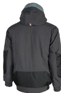
code PE113GM col. GREY METEORITE