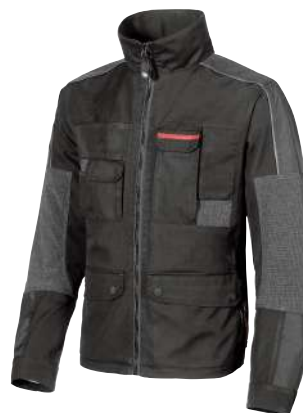
code IM011BC col. BLACK CARBON SIZES L-4XL