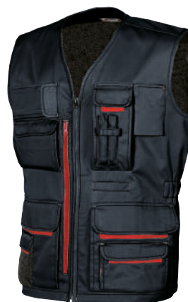
code HY018DB col. DEEP BLUE