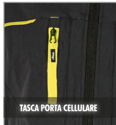
TASCA PORTA CELLULARE