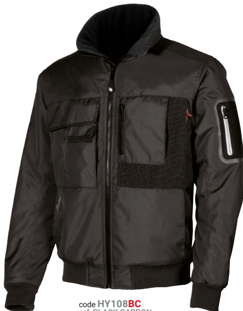
code HY108BC col. BLACK CARBON