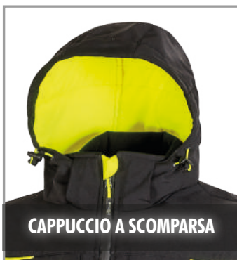
CAPPUCCIO A SCOMPARSA