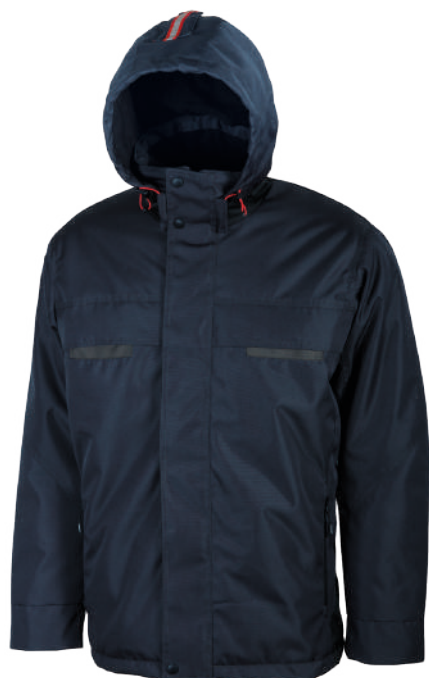
code DW026DB col. DEEP BLUE