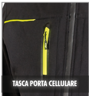
TASCA PORTA CELLULARE