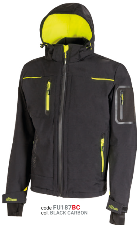
code FU187BC col. BLACK CARBON