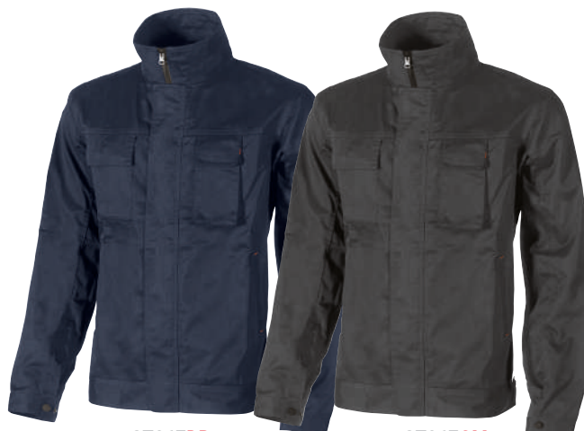
code ST067DB col. DEEP BLUE