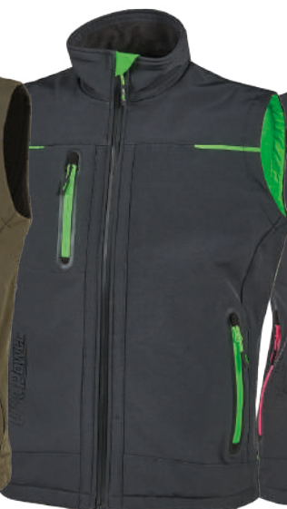
code FU188RL col. ASPHALT GREY GREEN