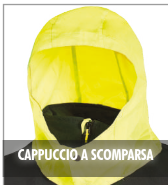
CAPPUCCIO A SCOMPARSA