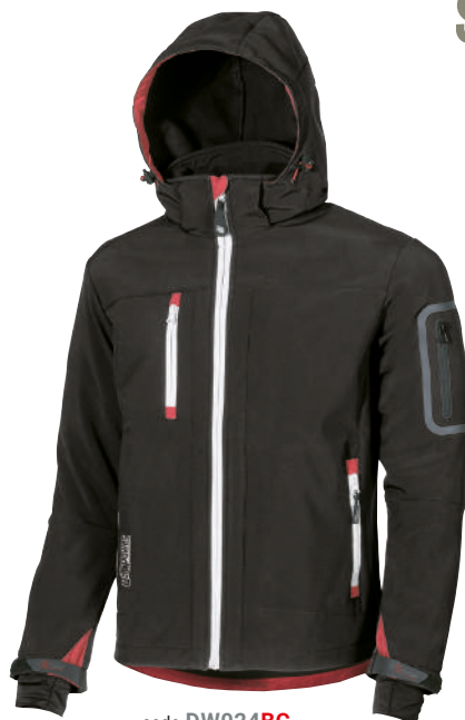
code DW024BC col. BLACK CARBON