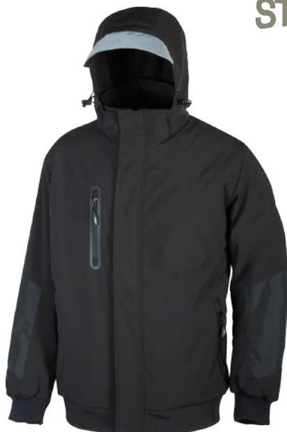
code PE113BC col. BLACK CARBON