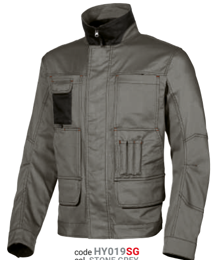
code HY019SG col. STONE GREY