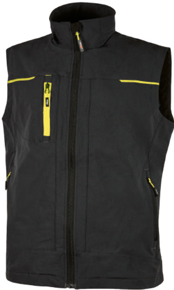
code PE181BC col. BLACK CARBON