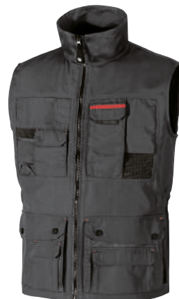
code SY004GM col. GREY METEORITE