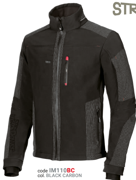
code IM110BC col. BLACK CARBON