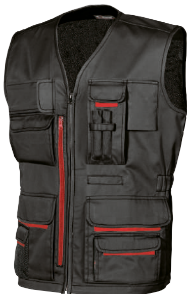
code HY018BC col. BLACK CARBON