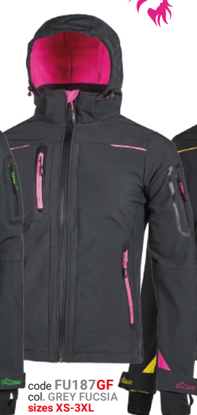
code FU187GF col. GREY FUCSIA sizes XS-3XL