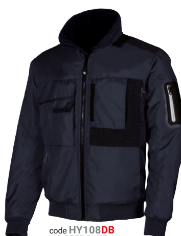
code HY108DB col. DEEP BLUE