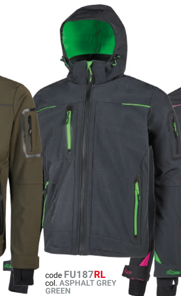
code FU187RL col. ASPHALT GREY GREEN