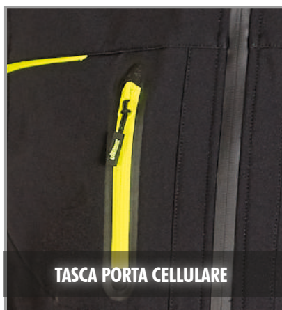
TASCA PORTA CELLULARE