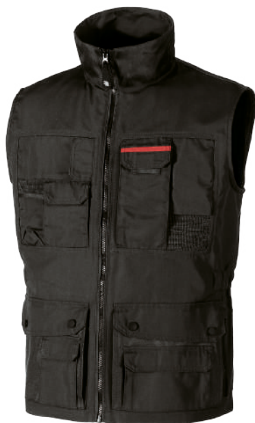
code SY004BC col. BLACK CARBON