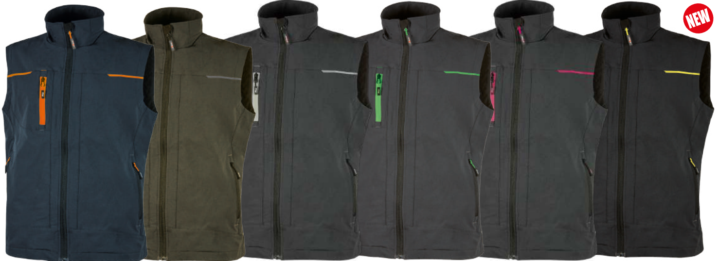
code PE181DB col. DEEP BLUE