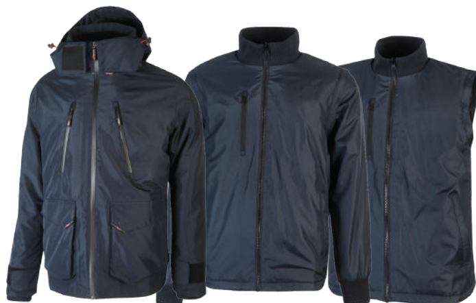
code IM177DB col. DEEP BLUE