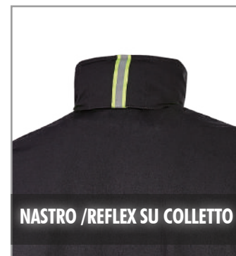
NASTRO /REFLEX SU COLLETO