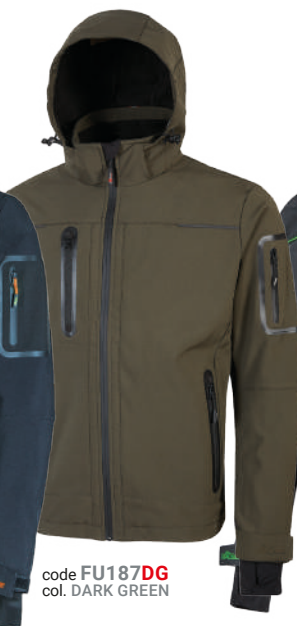
code FU187DG col. DARK GREEN