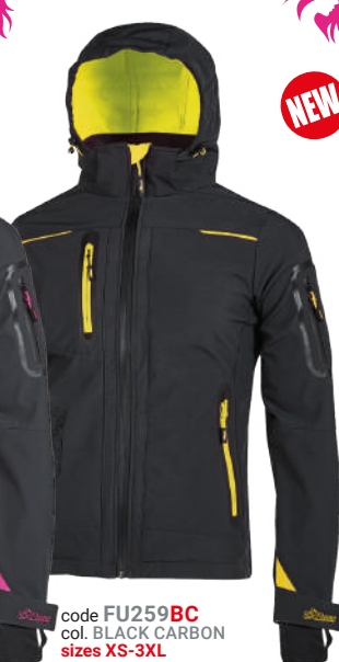
code FU259BC col. BLACK CARBON sizes XS-3XL