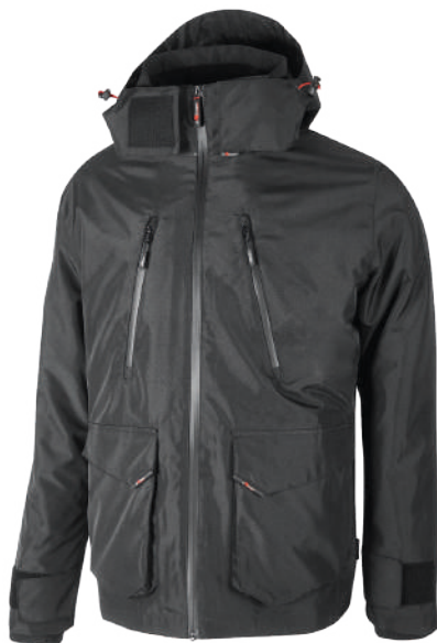
code IM177GM col. GREY METEORITE