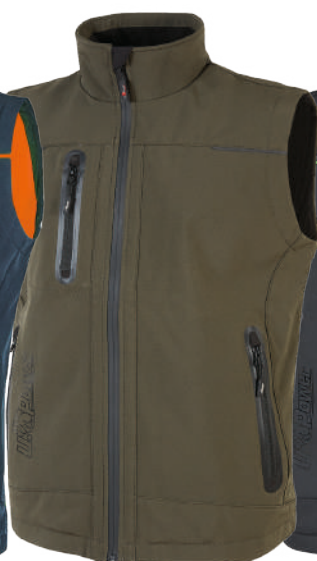
code FU188DG col. DARK GREEN