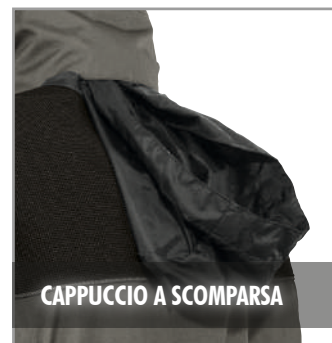
CAPPUCCIO A SCOMPARSA