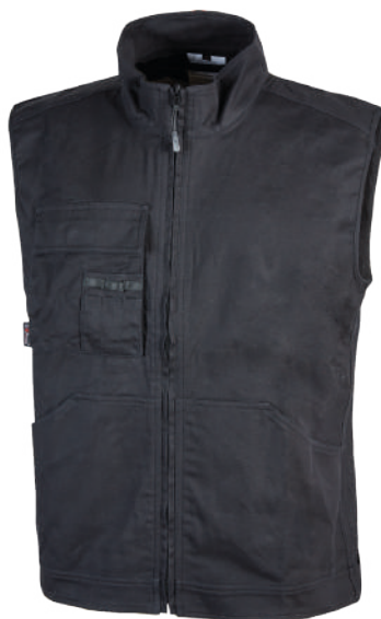
code EY148BC col. BLACK CARBON