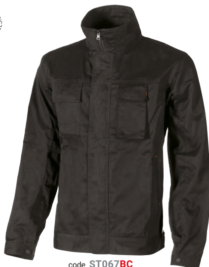
code ST067BC col. BLACK CARBON