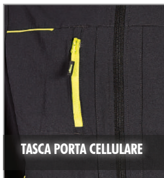
TASCA PORTA CELLULARE