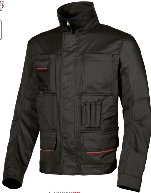
code HY019BC col. BLACK CARBON