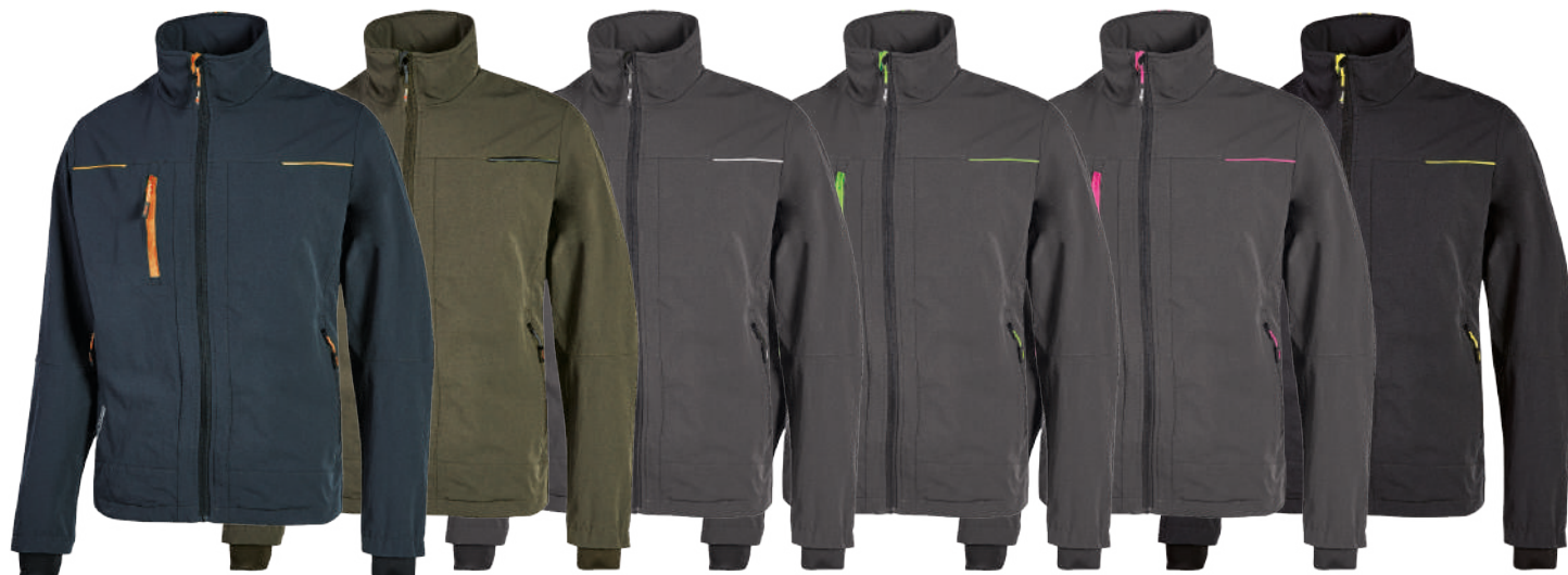
code PE178DB col. DEEP BLUE