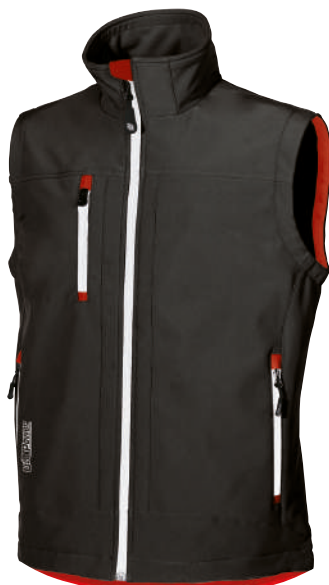
code DW025BC col. BLACK CARBON