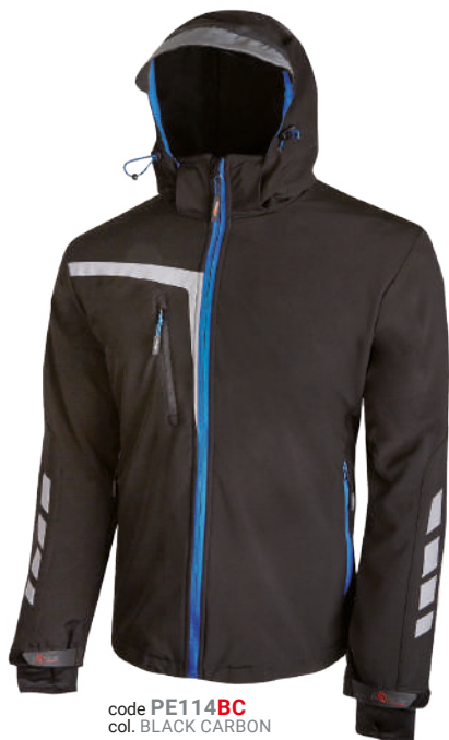
code PE114BC col. BLACK CARBON