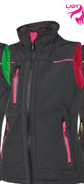
code FU188GF col. GREY FUCSIA sizes XS-3XL