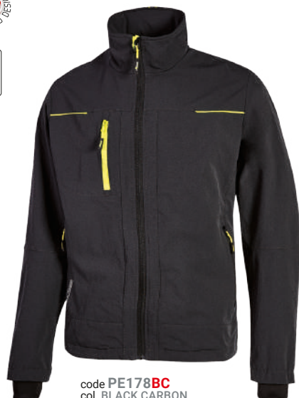
code PE178BC col. BLACK CARBON