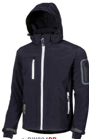
code DW024DB col. DEEP BLUE