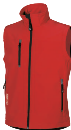
code DW025RM col. RED MAGMA sizes S-3XL