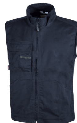
code EY148WB col. WESTLAKE BLUE