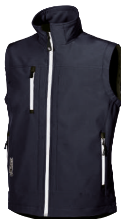
code DW025DB col. DEEP BLUE