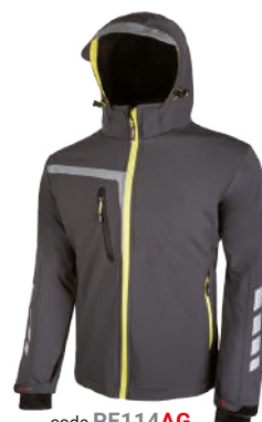
code PE114AG col. ASPHALT GREY