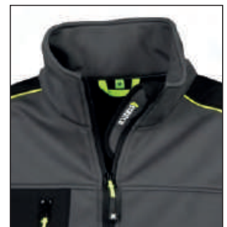
Tessuto proteggi mento con stampa 4 stretch