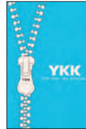
Cerniere nastrate YKK