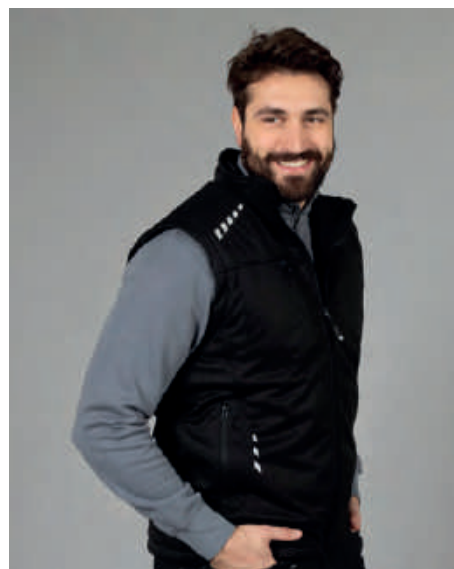
Stampe rifrangenti anteriori