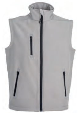
LIGHT GREY 992335