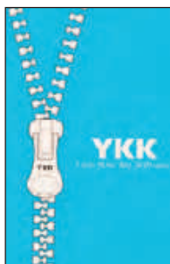
Cerniera centrale YKK