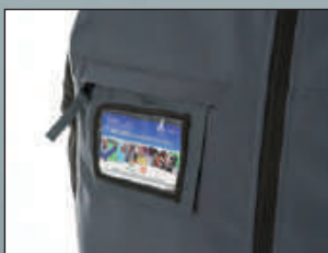
Portabadge estraibile a scomparsa