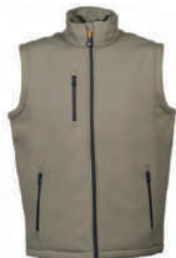
ARMY GREEN 993933