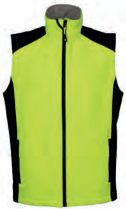
YELLOW FLUO/BLACK 994331