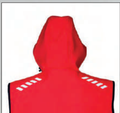
Stampe rifrangenti posteriori sulle spalle