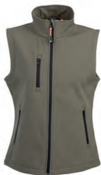
ARMY GREEN 992616