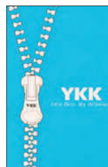
Cerniere nastrate YKK