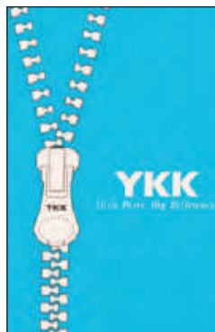
Cerniere nastrate YKK