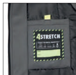
Tasca interna portafoglio, imbottitura in poliestere