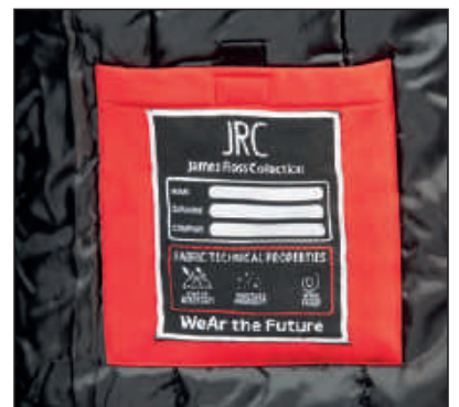
Imbottitura in poliestere, tasca interna portafoglio