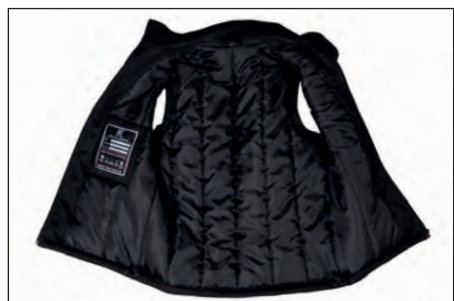
Imbottitura in poliestere, una tasca portafoglio, una zip invisibile per personalizzazione sul cuore