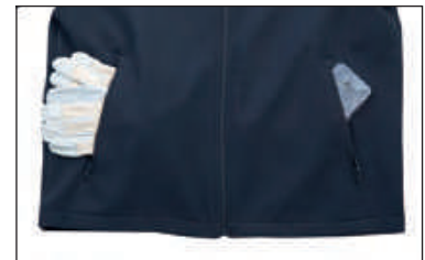
Due ampie tasche con zip