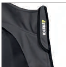
Tessuto a protezione del mento con logo 4STRETCH