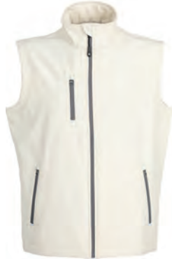
WHITE OFF 992338