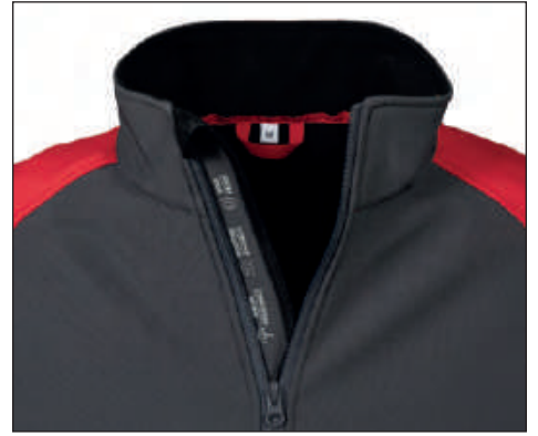
Tessuto proteggimento con stampa rifrangente