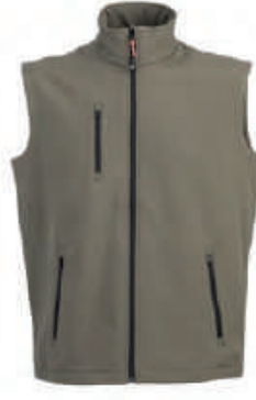
ARMY GREEN 992339