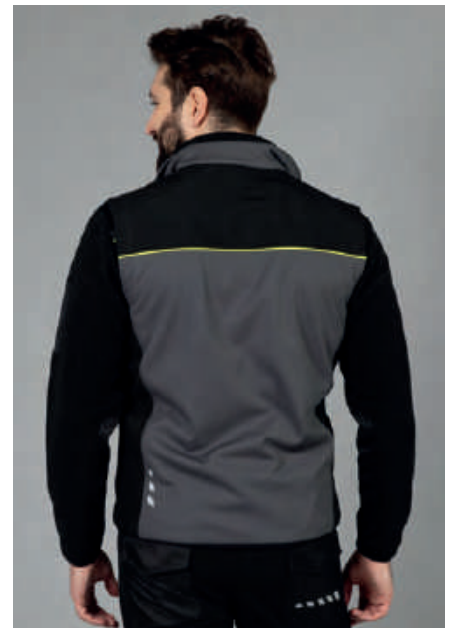
Stampe rifrangenti posteriori, piping giallo fluo sulla schiena