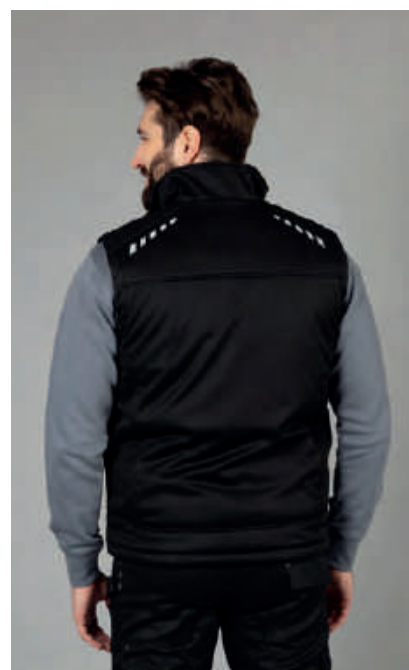
Stampa rifrangente sulle spalle