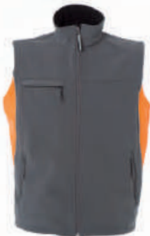
LIGHT GREY/ORANGE 987434