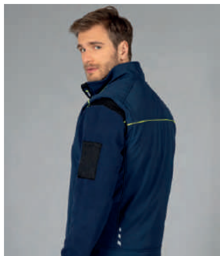
Stampa rifrangente posteriore, piping giallo fluo sulla schiena.