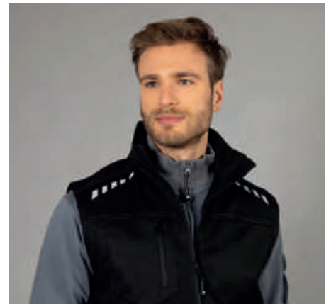
Stampe rifrangenti anteriori sulle spalle, una tasca con zip sul petto