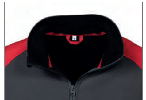
Nastro di rinforzo interno collo con gancio appendiabiti, no label