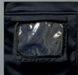
Portabadge estraibile a scomparsa