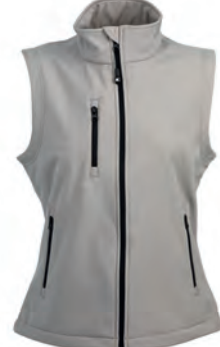
LIGHT GREY 992612