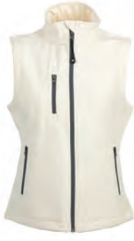
WHITE OFF 992615