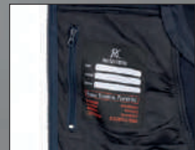
Tasca interna portafoglio