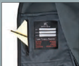
Tasca interna portafoglio