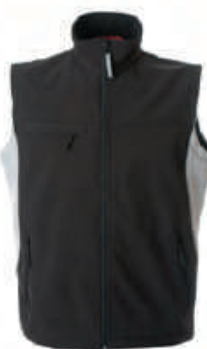
BLACK/LIGHT GREY 987431