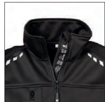
Stampa rifrangente sul tessuto proteggi mento